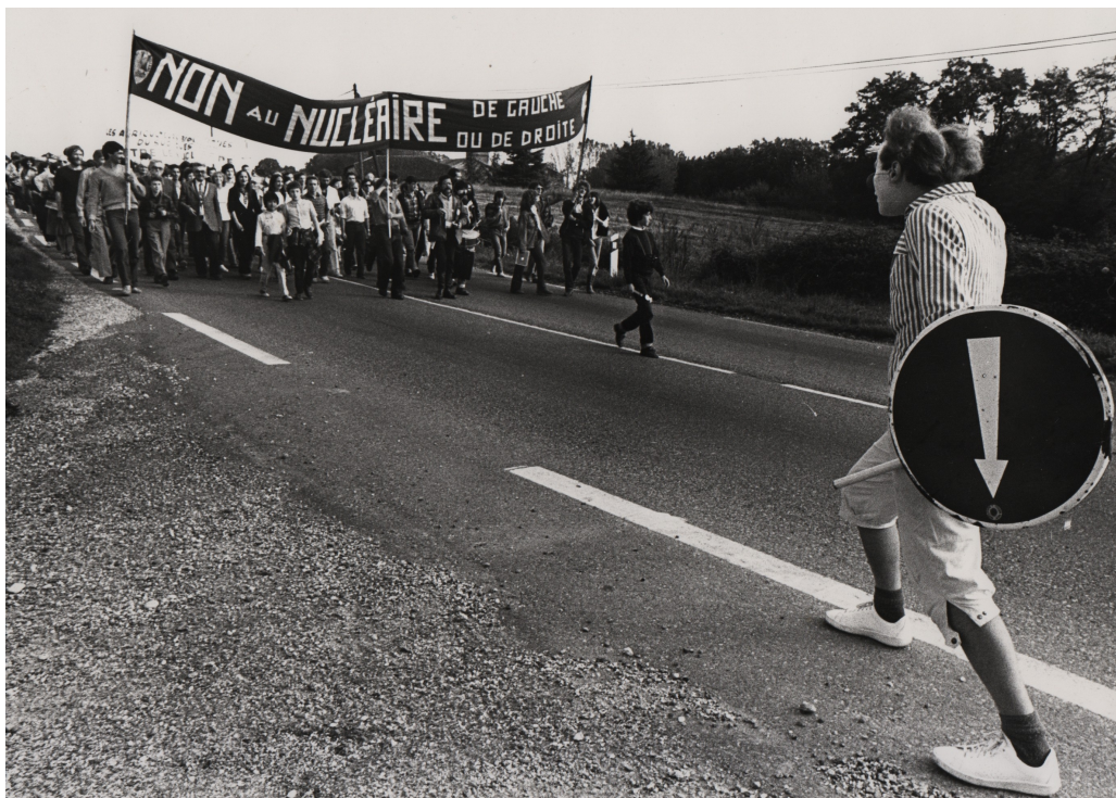
4 octobre 1981 - Marche de Valence-d'Agen à Golfech

Collectif La Rotonde c/o CRAS BP 51026 - 31010 Toulouse cedex 6 cras.toulouse@wanadoo.fr http://cras31.info/