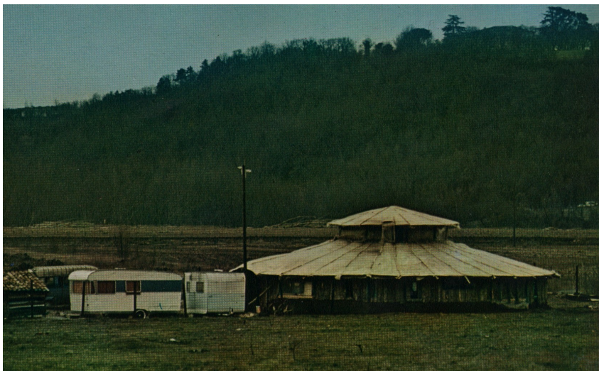
La Rotonde sera incendiée par les forces de l'ordre le 29 novembre 1981

autour des produits du terroir, nous passions de tables en tables, chauffés par des discussions tantôt bonne enfant, tantôt plus virulentes. Nous étions environ 300.