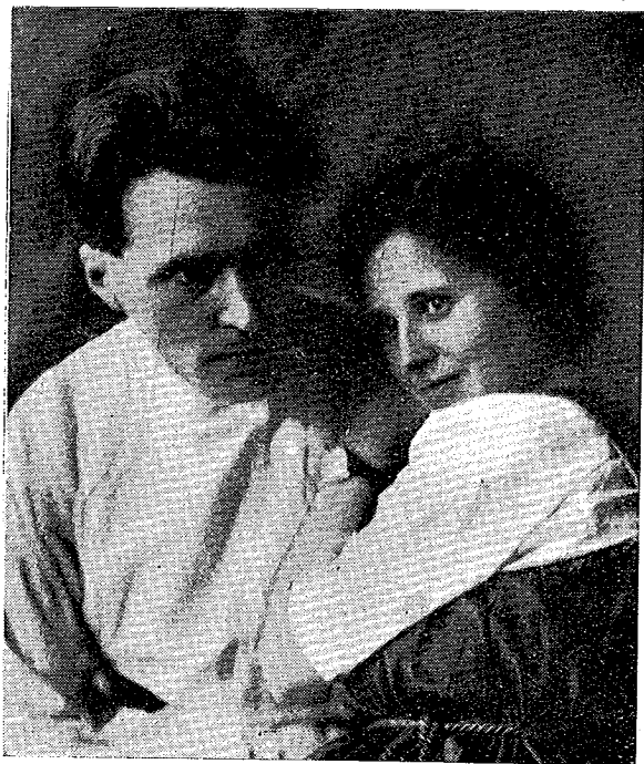
Victor Serge et sa femme

Je vous demande d'examiner cette affaire et de nous accorder nos passeports.