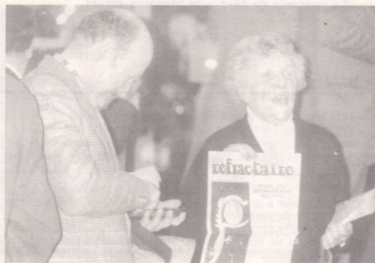
May vendant à la criée l'un des tout premiers numéros du « Réfractaire ».