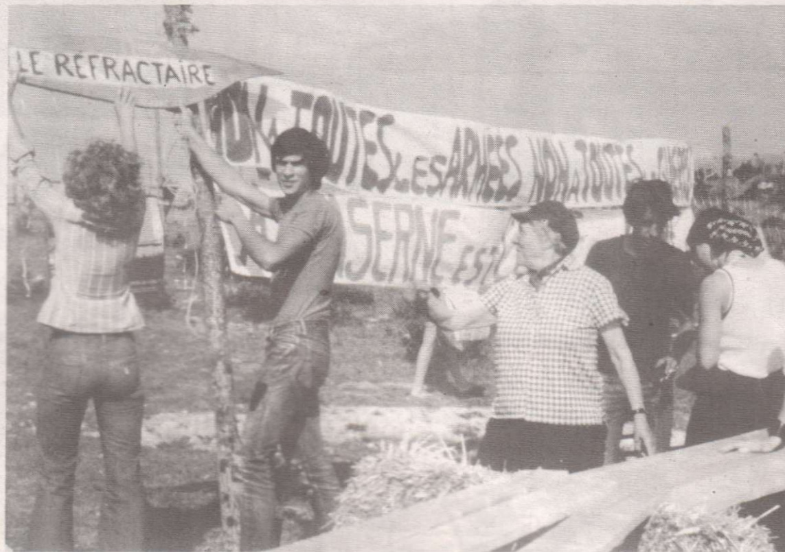
Sur le plateau du Larzac avec ces jeunes qu'elle aimait tant et qui, avec elle, disaient « non à toutes les armées, non à toutes les guerres ».