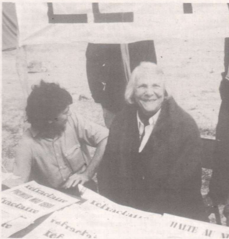
Lors d'un rassemblement contre le nucléaire.

« LE REFRACTAIRE » Responsable de la publication May Picqueray