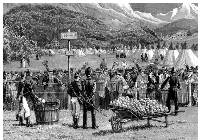
1898, quarantaine en Suisse pendant l'épidémie de choléra

La ponction démographique qu'effectue la syphilis en se propageant à partir du